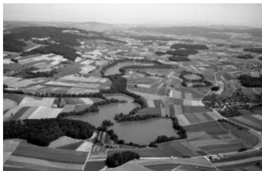
Seebachtal von Westen, Siedlungsplatz auf Halbinselspitze des Nussbaumersees