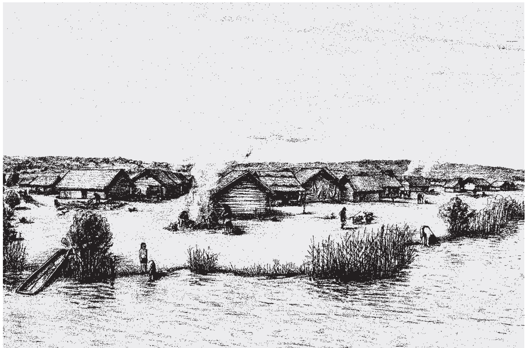
Dorfrekonstruktion, Zeichnung von Daniel Steiner

An Kleinfunden sind zu erwähnen: Nadeln, Messer, Meissel aus Bronze, Perlen aus Glas, Bernstein oder Gagat, Geweih-, Ton- und Steinobjekte (Spinnwirtel, Fadenspulen, Klopfsteine) sowie ein reiches Silexinventar (Pfeilspitzen, Messer).