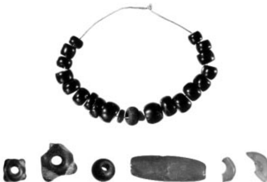
Perlen aus Glas, Bernstein und Gagat